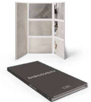
Ark Kit L DISCOVERY