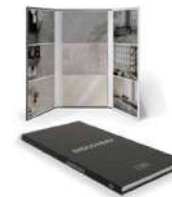
Ark Kit S DISCOVERY