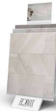
Expo Step DISCOVERY B