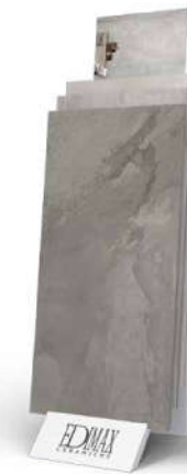
Expo Step DISCOVERY A